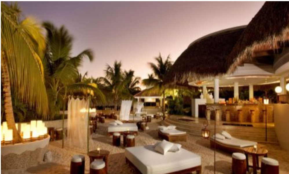
Melia Caribe Tropical 5*, Пунта-Кана.

Новая концепция отеля - Royal Service , предлагает следующие эксклюзивные услуги: