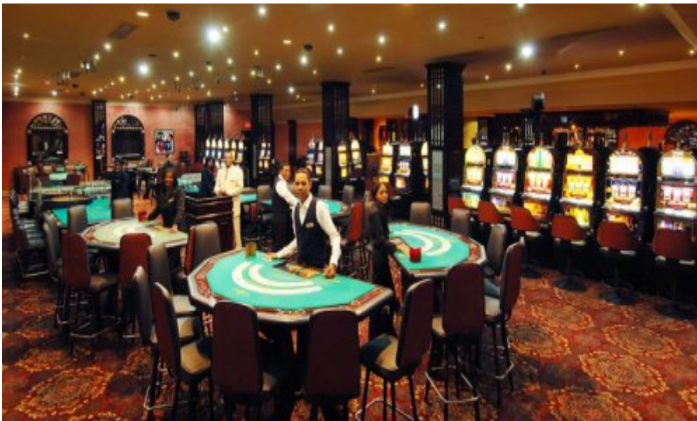
Melia Caribe Tropical 5*, Пунта-Кана.