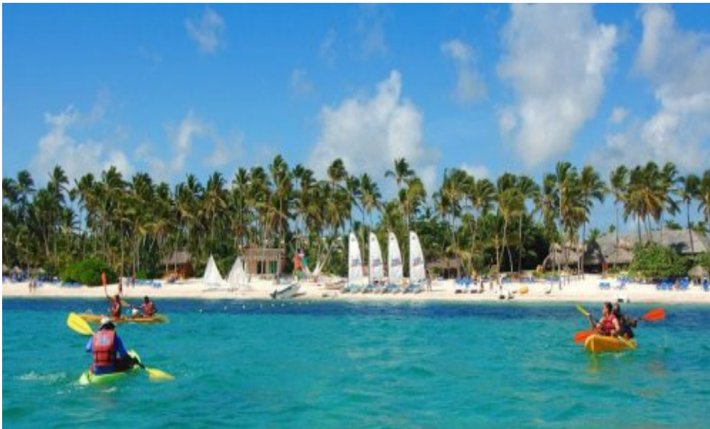
Melia Caribe Tropical 5*, Пунта-Кана.