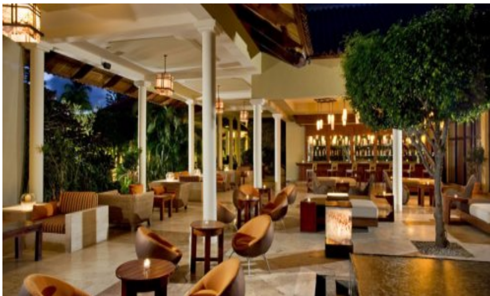
Melia Caribe Tropical 5*, Пунта-Кана.