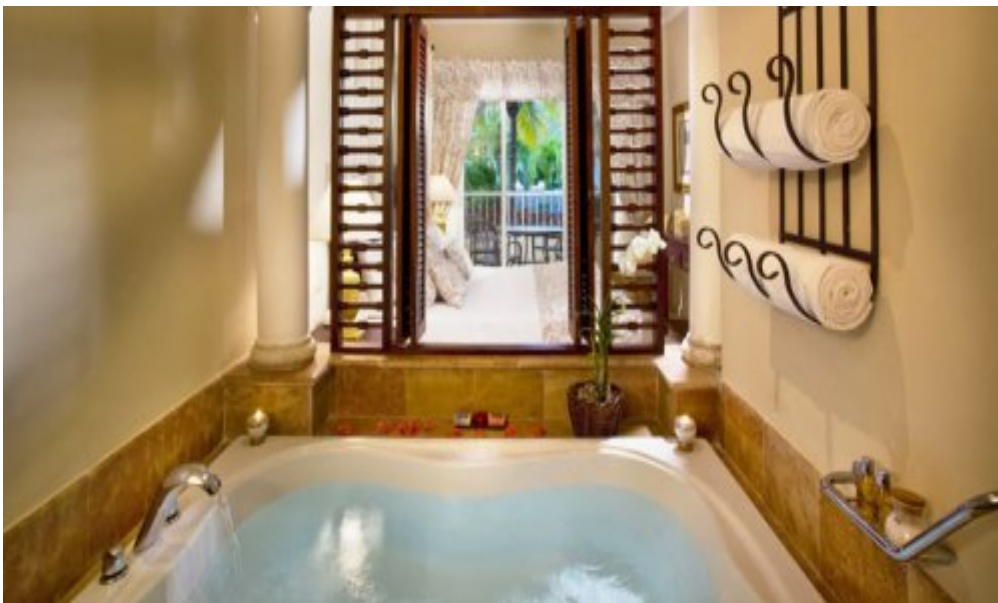
Melia Caribe Tropical 5*, Пунта-Кана.

Максимальная вместимость: 3 взрослых/ 2 взрослых и 2 детей 0-11 лет.