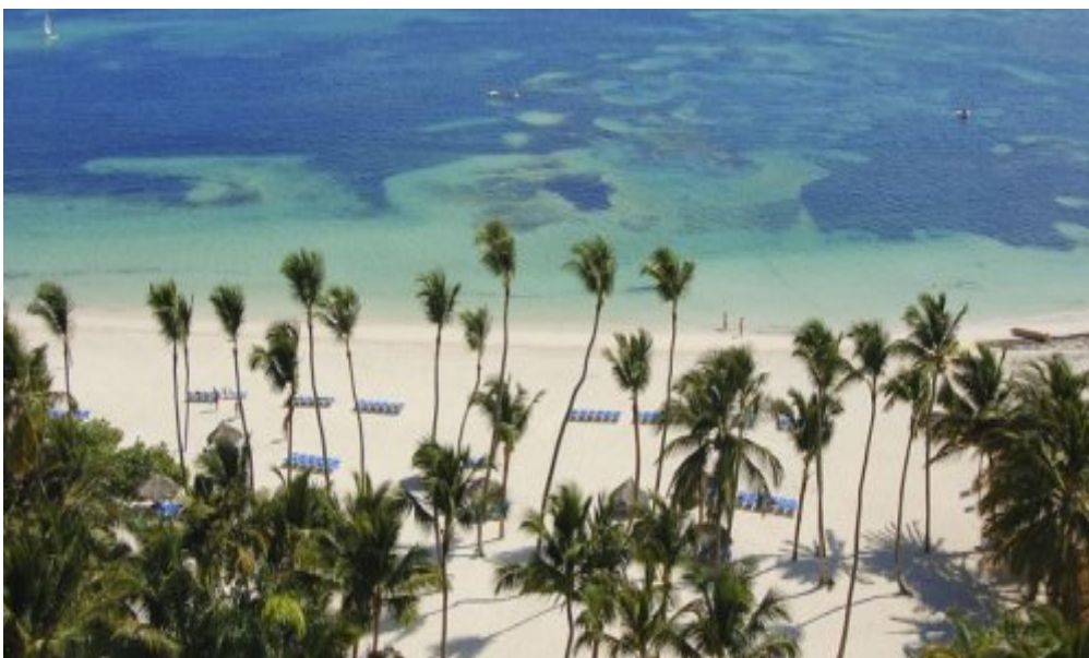
Melia Caribe Tropical 5*, Пунта-Кана.