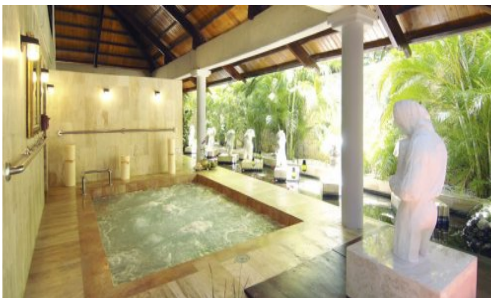
Melia Caribe Tropical 5*, Пунта-Кана.

Пляж - лежаки, зонтики, пляжные полотенца - бесплатно.