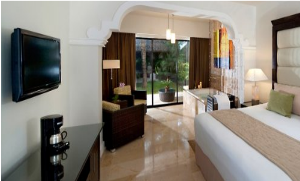
Melia Caribe Tropical 5*, Пунта-Кана.

Royal Service One Bed-room Master Suite: 76 кв.м, с видом на бассейн или на сад. Предлагают следующие дополнительные услуги: