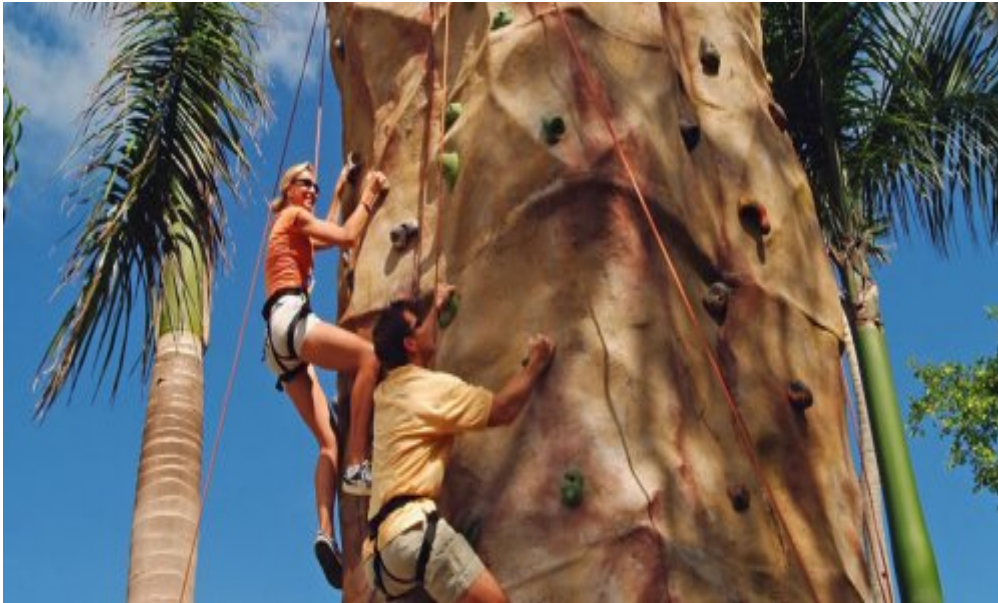
Melia Caribe Tropical 5*, Пунта-Кана.