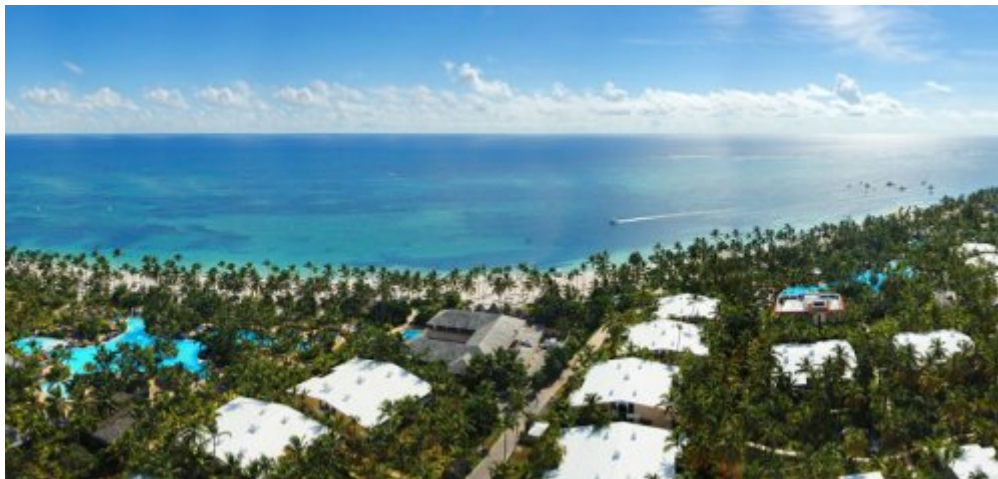
Melia Caribe Tropical 5*, Пунта-Кана.

Отель: находится в Пунта Кана, на восточном побережье Доминиканской Республики, всего в 20 минутах езды от международного аэропорта Пунта Кана, в 50 минутах езды от Higüey, в 90 минутах езды от Ла Романа и в 3 часах езды от Санто Доминго, рядом с новым торговым центром Palma Real Shopping Village и гольф-полем мирового класса Cocotal Golf & Country Club.