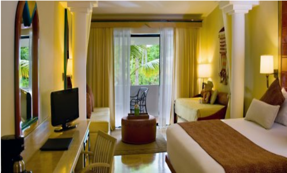
Melia Caribe Tropical 5*, Пунта-Кана.

Номера предлагают следующие дополнительные услуги: