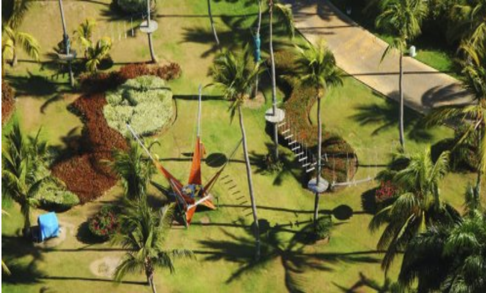
Melia Caribe Tropical 5*, Пунта-Кана.