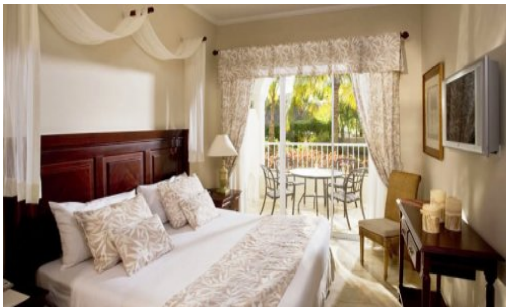
Melia Caribe Tropical 5*, Пунта-Кана.

Royal Service Master Suites: 48 кв.м с видом на бассейн или на сад, предлагает следующие дополнительные услуги: