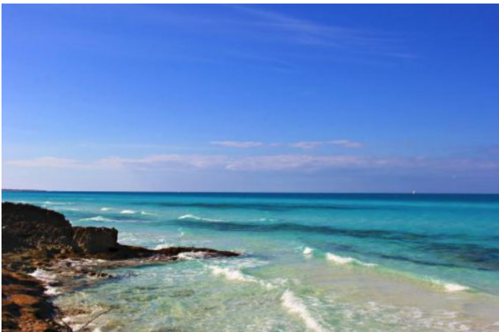
Санта Клара, Куба

Завтрак в отеле. Выезд в город Тринидад и Santa Клара. Экскурсия по городу с посещением скульптурного комплекса-мемориала Командующему Эрнесто Че Гевара – Площадь Революции Santa Клара им. Че Гевара . Время для фотографий. Обед в местном ресторане. Один напиток включен (местного производства и не коктейли). После обеда переезд в город Санти Спиритус , обзорная экскурсия по городу. Приезд в Тринидад, Размещение и ужин в гостинице BRISAS TRINIDAD DEL MAR «всё включено», либо размещение в ЧАСТНОМ ДОМЕ на завтраках.